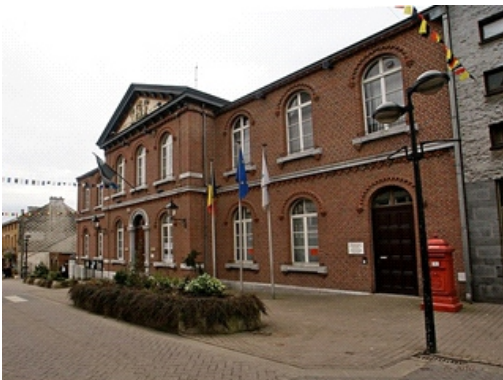
Het gemeentehuis van Kelmis / DG - Ostbelgien

Zet je licht er niet onder korenmaat! Ook jij kunt laten zien hoe geweldig het is Zij zijn. Leer ons kennen en doe met ons mee: Eerlijke Kans VoG Kelmis.