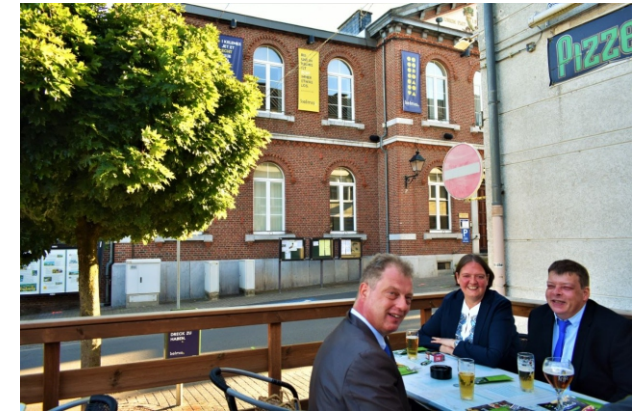
Gezellig samenzijn na het werk