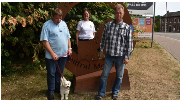
Het managementteam van Eerlijke Kans VoG

U kunt ons ook per e-mail bereiken op: info@.fairechance.eu