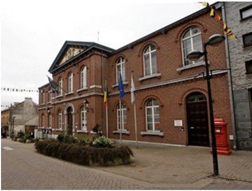
Das Rathaus von Kelmis / DG - Ostbelgien

Stellen Sie Ihr Licht nicht unter einen Scheffel! Zeigen auch Sie, wie großartig Sie sind. Lernen Sie uns kennen und machen Sie bei uns mit: Faire Chance VoG Kelmis.